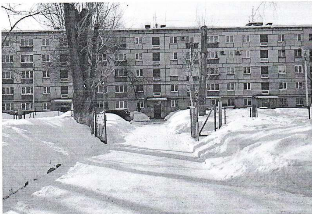
Подходы к зданию МБОУ СШ № 2, (ул. Дрогобычская, 67)

Подъездные пути к МБОУ СШ №2 (ул. Дрогобычская, 67А)